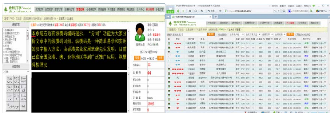
图 1 金松打字系统主界面