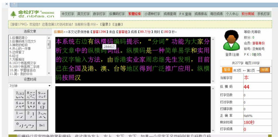
图 6 词组分析

利用系统的纵横码汉字“实时编码提示”功能，当学生遇到不会编码的汉字时，可自行查看编码，而不再需要向教师提问。针对纵横码词组丰富的特点，通过“词组分析”功能，向学生展示文章中的纵横码词组，有助于学生“自学”，也极大提高学生输入速度。如图 6 所示，紫色和绿色为词组，当鼠标放在词组上，显示词组编码。